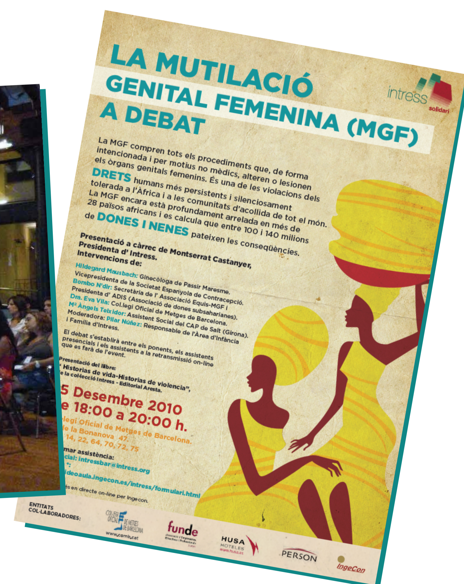
Imagen de la jornada "Pero no te olvides de Haití" que tuvo lugar en Madrid. Presentación de Exposición Fotográfica sobre Haití en el Centro Flassaders, Palma de Mallorca. Cartel de la jornada sobre la mutilación genital femenina que tuvo lugar en Madrid y Barcelona.